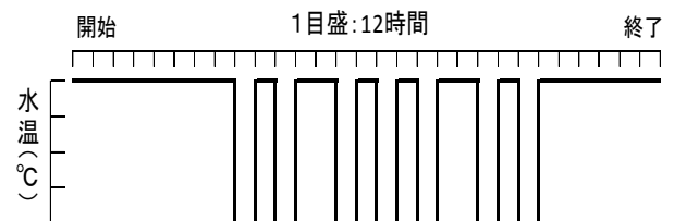
図 3 耳石温度標識パターン (2, 3n-2H)