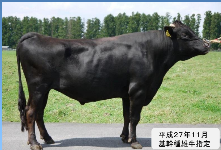
平成27年11月 基幹種雄牛指定