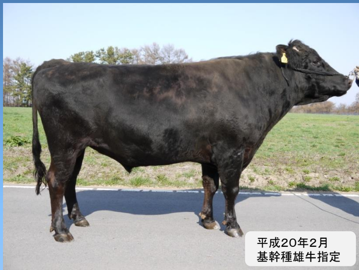
平成20年2月 基幹種雄牛指定