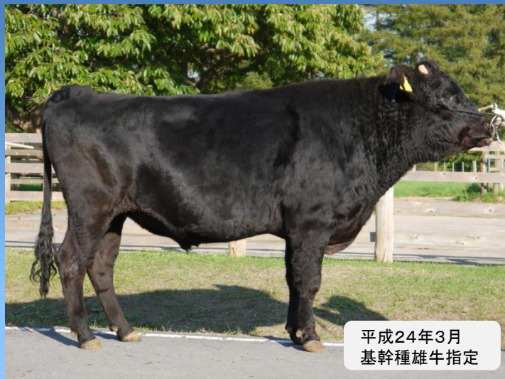
平成24年3月 基幹種雄牛指定