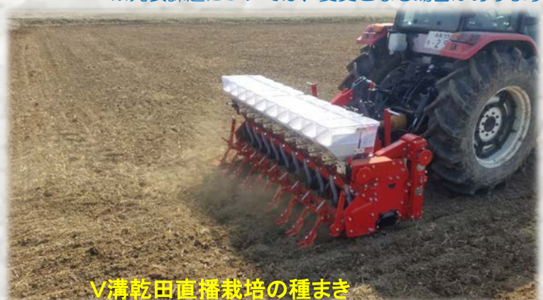
V溝乾田直播栽培の種まき