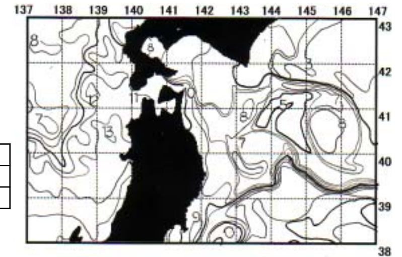
資料: (社) 漁業情報サービスセンター 北部太平洋海況速報 第15号5月23日

○日本海沿岸域の表面水温 11℃台で、前回と変わっていません。昨年同期と比較すると1～2度低い水温となっています。