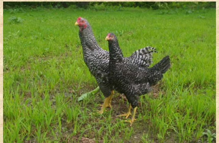
プレミアム青森シャモロック