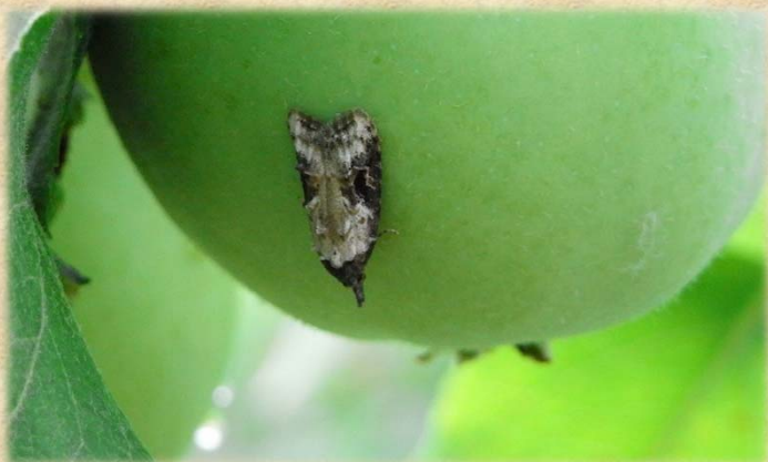
モモシンクイガ成虫