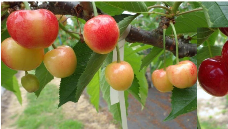
↑ 満開後40日頃の果実