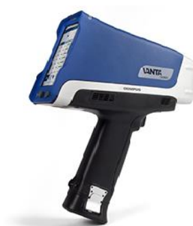
ハンドヘルド蛍光X線 分析計