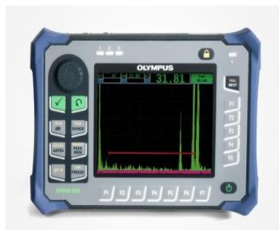
超音波フェーストアレイ 探傷器