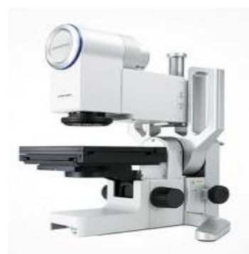
デジタルマイクروسコープ DSX