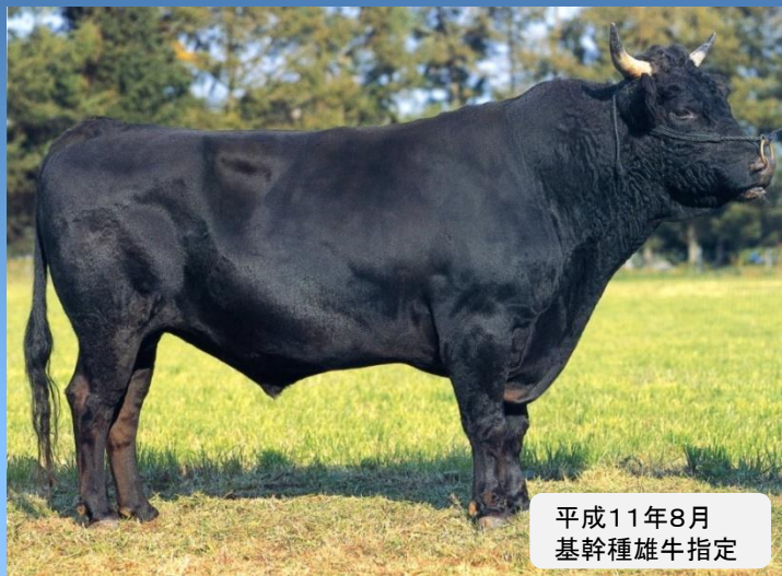
平成11年8月 基幹種雄牛指定