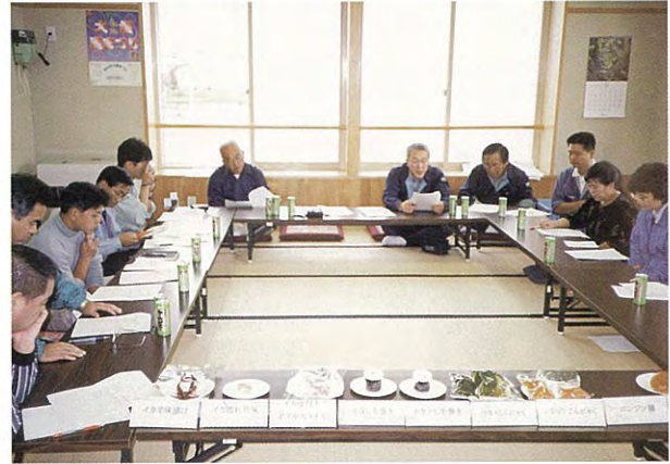
巡回指導 (平成11年度)