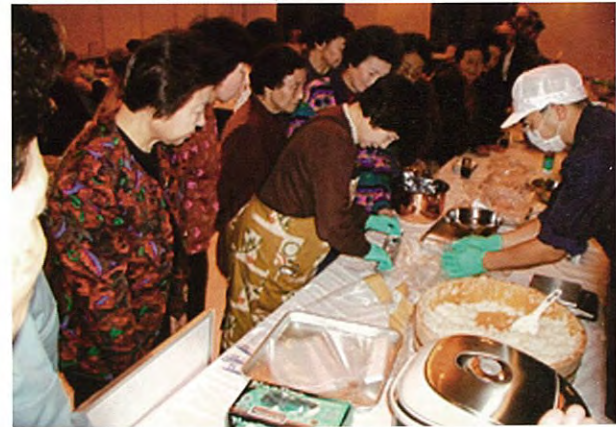
ヒメマス押し寿司製造講習会 (平成16年度)