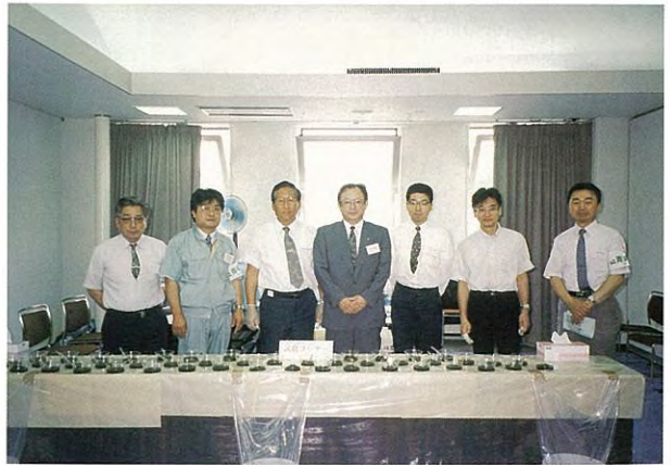
第1回水産試験研究機関公開デー 「つるつるワカメ」試食紹介 (平成8年度)