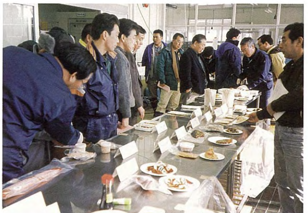
展 示 試 食 会 (平成10年度)