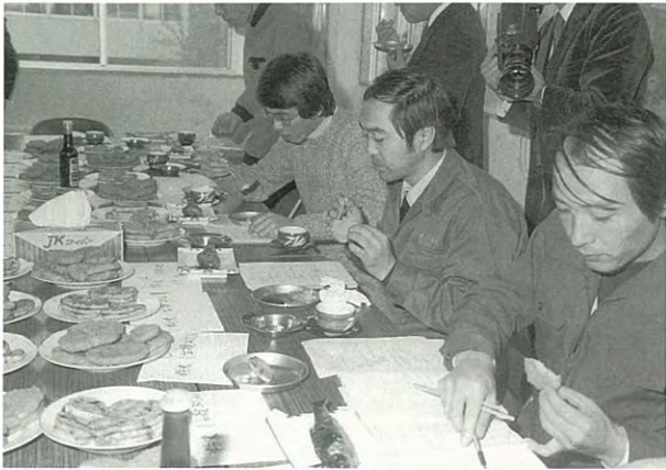
長イモ入りサバハンバーグ試食会 (昭和54年度)