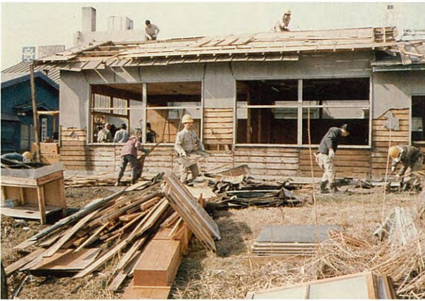
旧庁舎の解体作業（昭和52年度）