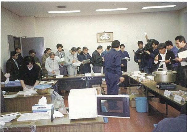
展 示 試 食 会 (平成9年度)