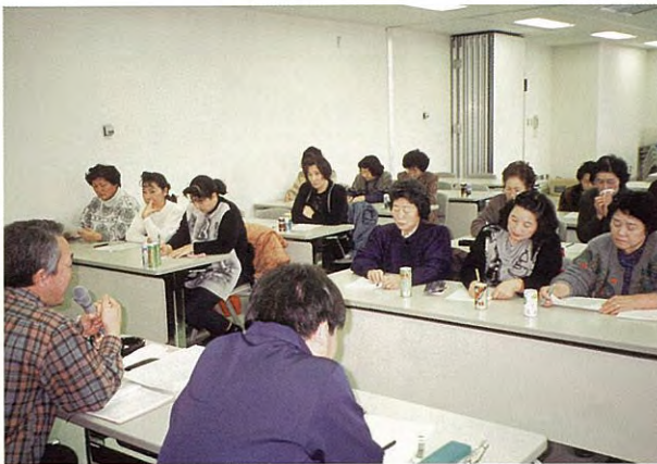
巡回指導 (平成9年度)