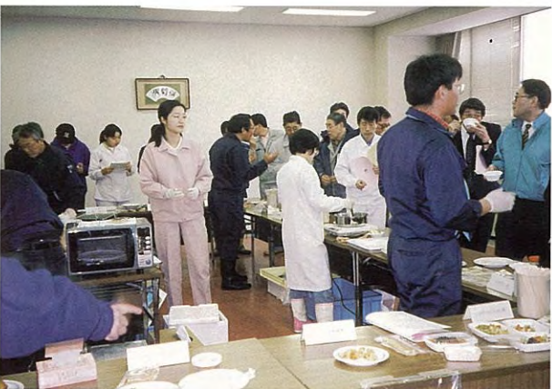
展 示 試 食 会 (平成10年度)