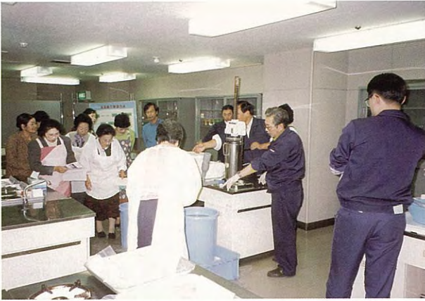
活彩あおり生涯学習フェア (平成7年度)