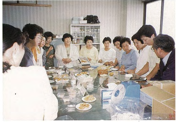
商品化推進委員会 (平成9年度)