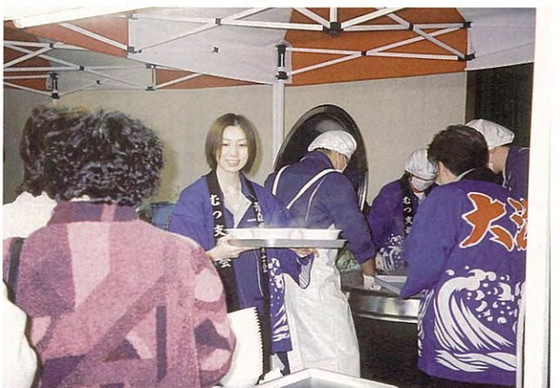
農 林 水 産 祭 (平成13年度)