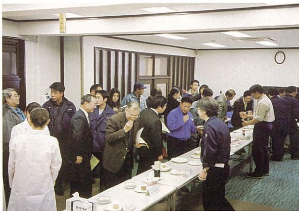
加工技術懇談会 (平成12年度)