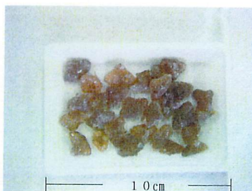
写真-1 ヒシグラッセ