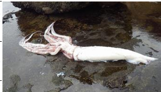
打上げられた様子

平成27年1月13日、深浦町椿山南方の岩場に外套長127cmの大型イカが打ち上げられ、査定の結果「ダイオウイカ(オス)」でした。(鰺ヶ沢水産事務所より)