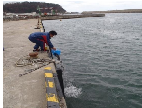
キツネメバル(当歳魚)標識放流