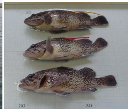
ダートタグ標識魚(2歳魚)