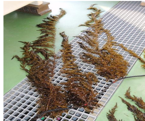
図 3月に収穫した養殖アカモク

まだ9月以前の沖出し時期の検討の余地はありますが、ケーブルタイを使った種苗量産技術などの技術開発で、藻場造成の一手法として応用できるようになりました。