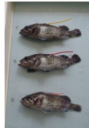
ダートタグ標識魚(2歳魚)