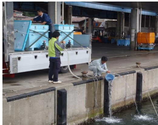
キツネメバル(当歳魚)標識放流

市場調査を行い放流効果の把握にも努めていますが、標識魚を発見された場合は、最寄りの水産事務所または当研究所までご一報ください。