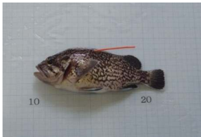
図1 ダートタグ標識魚