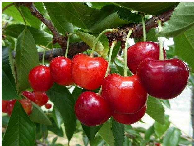
満開55日後頃の果実

主 催：おうとう「ジュノハート」普及促進研究会 おうとう「ジュノハート」ブランド化推進協議会 三八地域県民局地域農林水産部