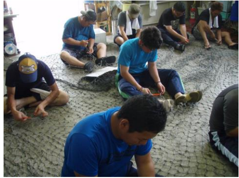
基本的な魚網補修技術