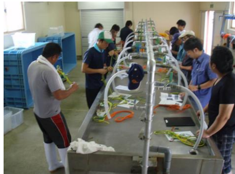
クロスロープの接合(川内町漁協青年部)