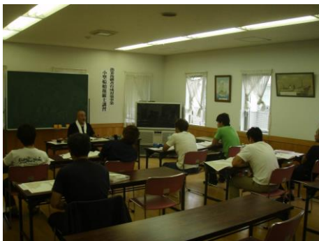
小型船舶操縦士学科講習