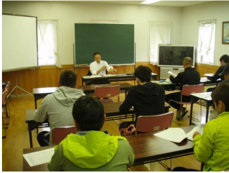
水産知識(簿記・漁業経営)