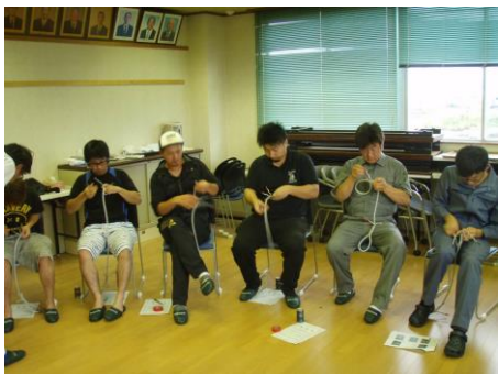
三打ちロープの接合(蓬田村漁業研究会)