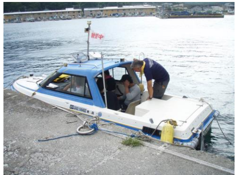
小型船舶操縦士学実技教習