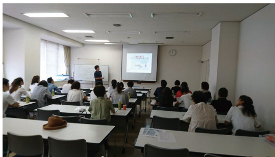
企業向け衛生指導の様子

【目的】企業等の加工現場における課題に対して、技術的な支援を行う。 【結果】製造等にかかる課題解決や製品の試作、現場での衛生指導等、平成30年度は122件の相談に対応した。 【今後】企業等の要望や課題に即応した支援を継続する。