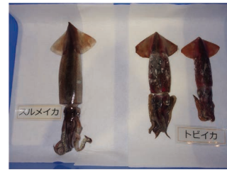
左:スルメイカ 右:トビイカ

【目的】水産加工企業等のニーズに対応して、原料特性等の調査研究を行う。 【結果】関係者の要望等に対応し、最近注目されているトビイカの成分分析や、八戸前沖さばのブランド認定期間決定の根拠となる粗脂肪の分析等を実施した。 【今後】業界のニーズ等に対応した調査研究を継続して行う。