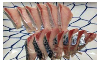
-60℃で10か月冷凍保管したサバ刺身

【目的】旬の良質なサバを安全に通年供給するための取扱い条件を検討する。 【結果】脱血活締めにより高鮮度で急速凍結したサバは、-30℃以下で保管することにより長期間刺身で食べられる品質を維持できることが明らかになった。また、飲食店における試験販売の結果、消費者から高い評価が得られた。 【今後】事業者の支援を継続するとともに、関係機関と連携し、県内における普及を図る。