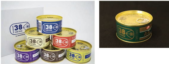
商品化された開発品

【目的】水産加工品の商品開発をサポートする。 【結果】企業の商品開発を支援し、平成30年度は7品目が商品化となった。また、企業の開発活動をサポートするため、44品目の製品マニュアルを作成した。 【今後】企業の製品づくりを支援するとともに、新たな品目のマニュアル化を行う。