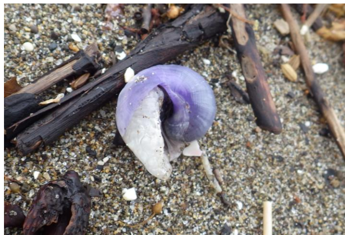
図 ルリガイと粘液胞