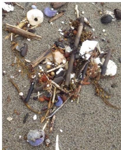
図 漂着したルリガイ

以前は函館市周辺や石狩浜での漂着記録が報告されており、青森県でも2018年に竜飛崎でルリガイの漂着が確認されていますが、今回のような大量漂着の報告はされていません。