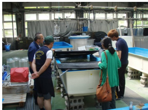
水産知識(水産総合研究所の概要)