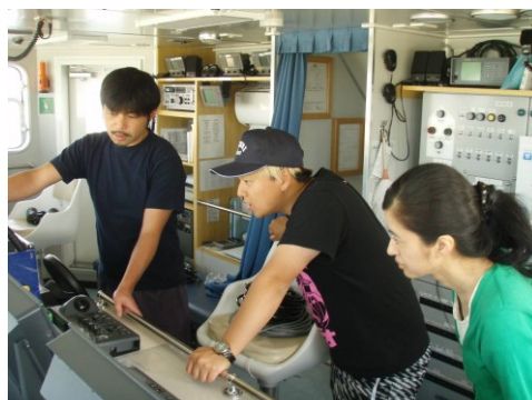
視察研修(青森県栽培漁業振興協会)