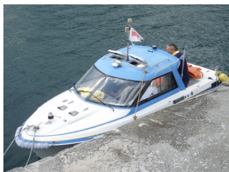
小型船舶操縦士教習