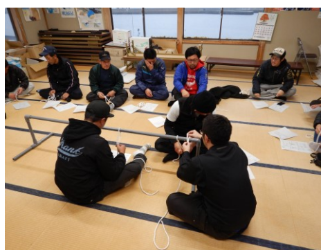
出前講座(十三漁協)