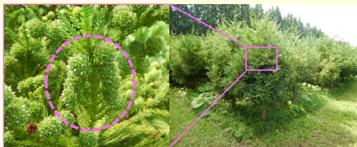
ジベレリンの葉面散布処理により着花・結実した採種木

※ジベレリンの連年処理は採種木を衰弱させるため、4か所の採種園を整備し、1年1か所に処理している（4年サイクル）。