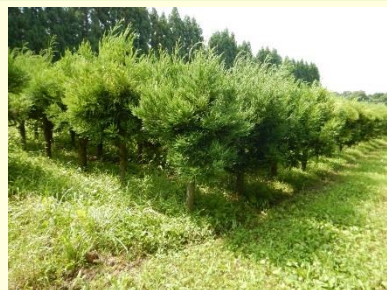
萌芽枝育成後の採種木