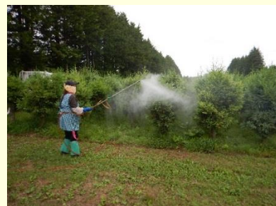
ジベレリン（植物ホルモン）処理により花芽分化を促進