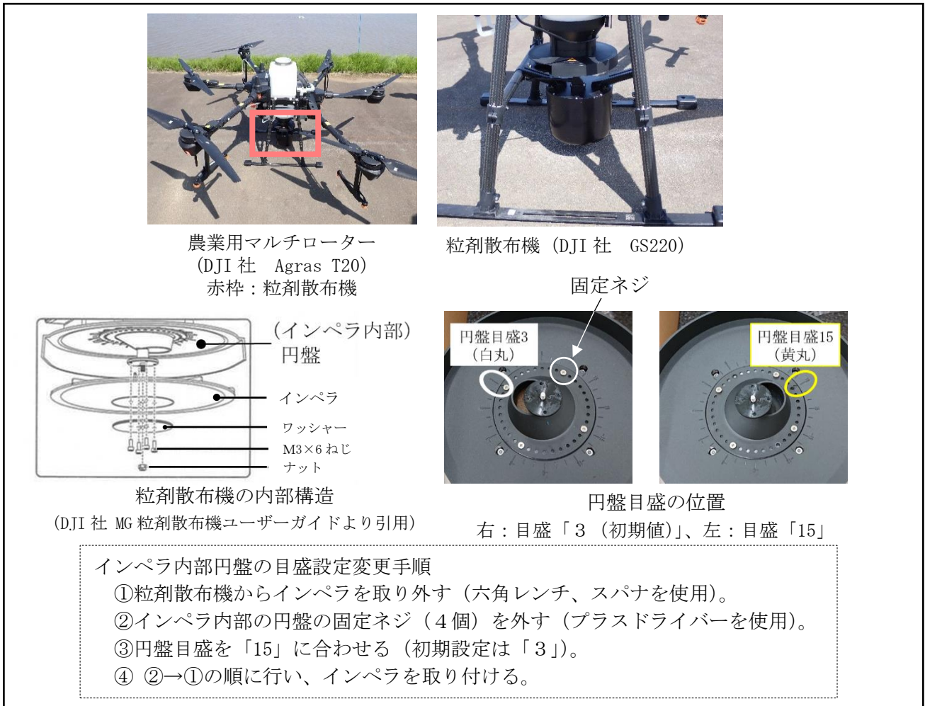
図1 粒剤散布機 (DJI 社 GS110、GS220 等) におけるインペラ内部の円盤目盛の変更方法