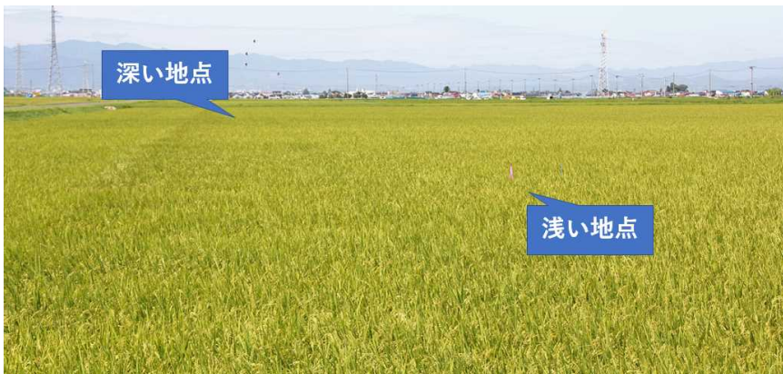
写真1 8月25日現在の生育状況