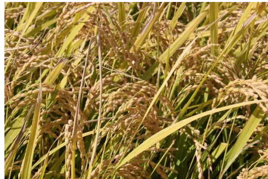
写真 9月26日現在の登熟状況