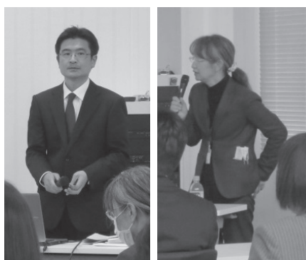
ステップアップ講座 （健康食品Ⅱ）