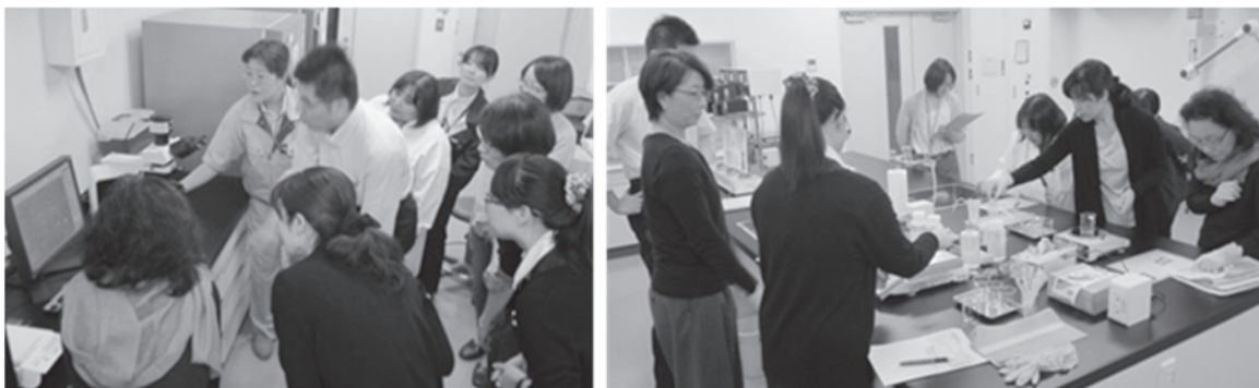
ステップアップ講座（化粧品分野） 第1回集合研修

また、県内企業におけるPGを機能性関与成分とする機能性表示食品の届出を支援するために、PGを定量するための高速液体クロマトグラフ装置を導入した。