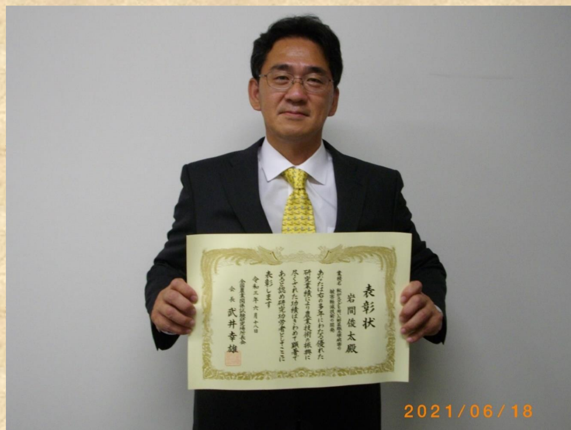
表彰式【令和3年6月18日】