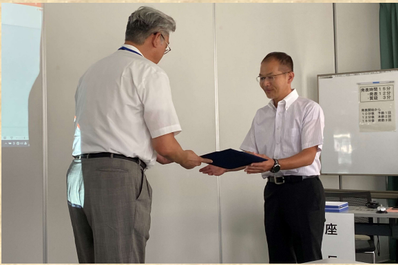
右：神田水稻品種開発部長

令和4年産米は、(一財)日本穀物検定協会の食味ランキングで「特A」評価を取得した。