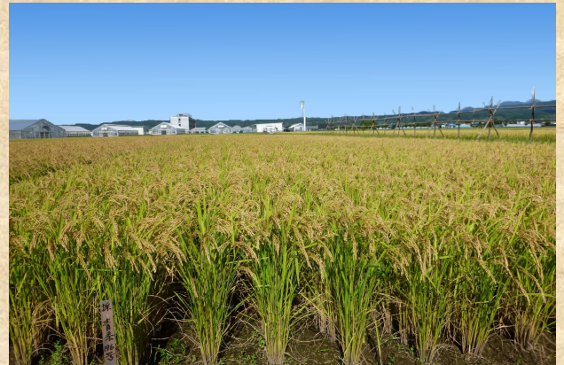
「はれわたり」の草姿