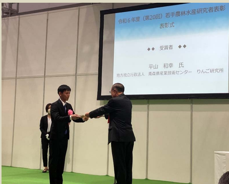
【授賞式】 令和6年11月27日

本研究では、主原因がDMI剤に対する耐性菌の蔓延であることや本剤の感受性低下メカニズムを解明し、遺伝子診断技術の開発に寄与しました。さらに、感染時期を再検証し、防除適期の解明や、耐性が発達したDMI剤に替わる各種薬剤の予防及び治療効果を評価し、耐性菌が発達しにくい新たな防除体系を構築して普及に移したことで、青森県の高品質りんごの安定生産に貢献したことが、高く評価され、本県初の受賞となりました。