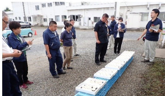
共進会の審査の様子