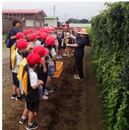
生徒にナガイモの育ち方を説明