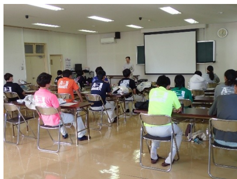
営農大学生に対する講義の様子

10月2日、青森県営農大学校生徒が来所し、野菜病虫害各論の講義・実習が行われました。毎年2回に分けて行われる本講義では、野菜病虫害の発生生態や防除技術などについて、病虫害管理部の研究員が座学や野外実習により教えています。第2回は、ナガイモ、ゴボウ、ネギの病虫害を中心に座学とは場観察の講義を行いました。生徒は熱心に聞いて、ほ場では病気や害虫の発生状況を確認していました。