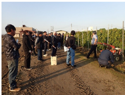
試験ほ場での概要説明の様子