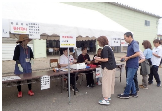
野菜販売に並ぶ参観者

ミニ講座では、各部の最新の成果として、栽培部の今研究管理員からは「近年の高温に応じたサツマイモのつくりかた」として、温暖化が進む中で新作物として期待されるサツマイモの安定生産技術について紹介しました。病虫害管理部の近藤総括研究管理員からは「近年県内で確認された野菜の細菌病のはなし」として、青森県内で初確認された「ネギ腐敗病」と「カボチャ果実斑点細菌病」の症状の特徴と耕種的防除対策についてわかりやすく紹介しました。