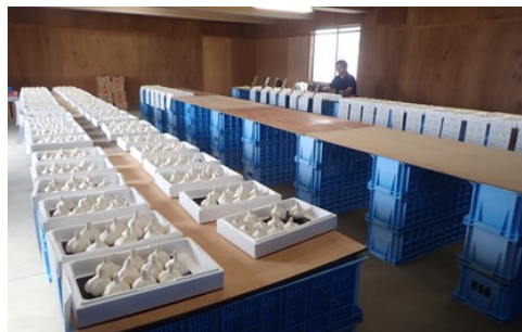
にんにく共進会の展示の様子

JA全農あおもりによるにんにく共進会の審査会が公開デー前日の9月4日に行われ、県内のニンニクを取り扱っている7農協から合計110点の出品がありました。形状の揃いや大きさなどの基準に基づく厳正な審査により、最優秀賞1点、優秀賞1点、優良賞5点が選ばれ、最優秀賞にはJA十和田おいらせ管内の生産者のものが選ばれました。共進会に出品されたニンニクは、毎年公開デーで展示され、今年度も多くの来場者に好評を得ていました。