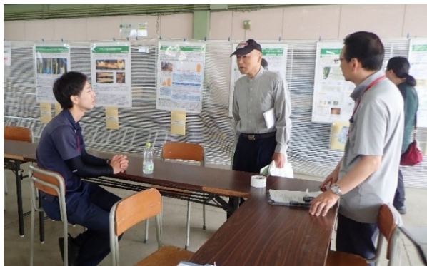
農事相談に対応する職員