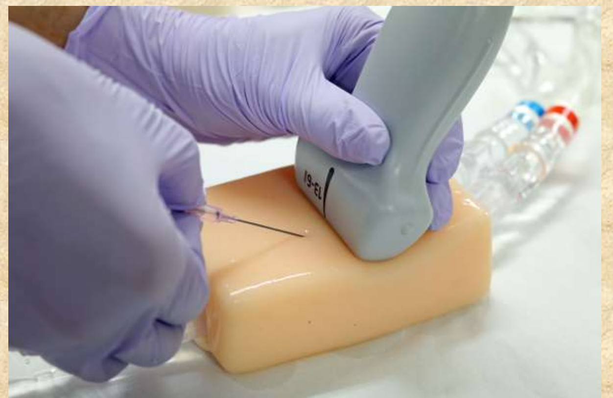
皮膚モデルを使用している様子