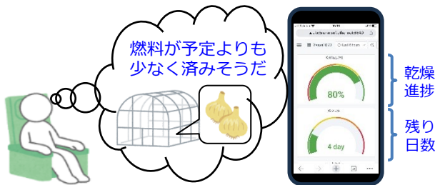
生産性向上イメージとスマホ表示例

【結果】温湿度センサ及び重量センサにより、乾燥工程の進捗をリアルタイムで遠隔モニタ可能なほか、乾燥完了日を予測可能なシステムを開発した。