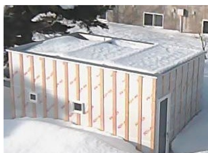
屋根融雪システム実証試験棟