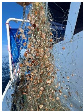
採苗器に付着した稚貝