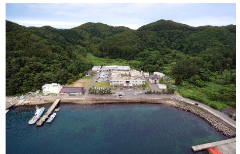
上空からの水産総合研究所