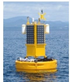
海況自動観測ブイ

海的环境調査やイカ類の資源調査を行い、解析結果を漁業関係者に情報提供するとともに、ホタテガイが毒化する仕組みについて研究しています。