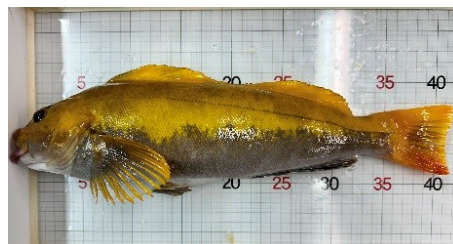
婚姻色が出ているアイナメ