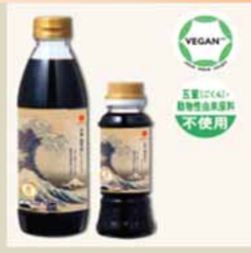
図1. 金箔しいたけ(左)と北斎旨みだし(右)