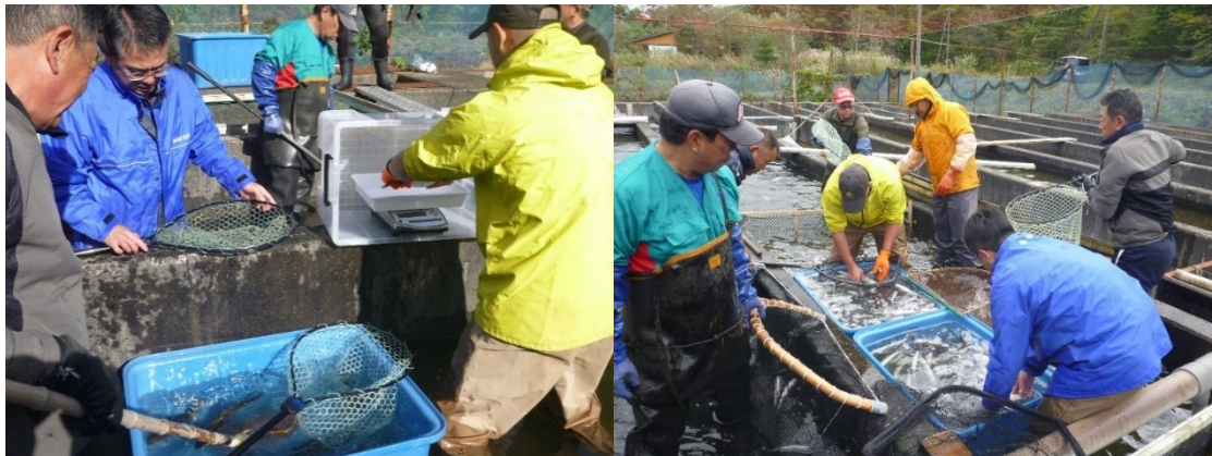
図2 2023年産海面養殖用種苗の選別作業及び魚体測定

798kg、野辺地川漁協所有のトラックに175kg、74kgの2回で合計249kgを積み込み、運搬した。11月21日、22日の合計で1,811kgの種苗を、大畑漁港に設置してある水道水50%、海水50%の海水馴致生簀に投入し、海水馴致を行った(図3)。11月23日夕方に100%海水で馴致完了した。馴致完了後は5m×10m生簀に移し、沖合生簀に收容した。積み込み作業から運搬、海水馴致生簀へ收容までのへい死はなく、種苗の状態は良好であった。また、2025年1月17日の聞き取りでは海水馴致時やその後のへい死はほとんどなく、餌食いや成長にも問題はない。