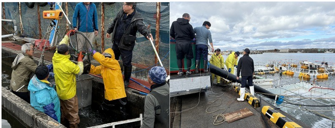
図3 2023年産海面養殖用種苗の積み込み・運搬～海水馴致