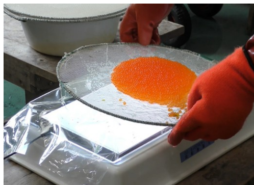
図1. LEDライトパネルによる卵の選別

試験に用いた親魚は2022年12月22日から電照により長日処理 1) を行い、2023年6月8日から7日間隔で2-フェノキシエタノールを3,000倍に希釈して麻酔をかけ、腹部をさわって採卵できる親魚を選び(以下、熟度鑑別)、排卵を確認した青森系ニジマス雌22尾と、予め採精可能なことを確認したスチールヘッド系ニジマス偽雄を10尾用いた。ニジマスの卵は、排卵直後が最も発眼率、受精率が高く、日数の経過にともなって両率が低下することがわかっているため 2) 、搾出した卵はLEDライトパネルを用いて底面から透過し(図1)、目視により油球の分布を確認することで発生段階を確認し、○、△、×と卵質の選別を行い(図2)、油球が全体に散在している卵(○)及び、やや油球分布に勾配のみられる卵(△)を0.9%食塩水で3回程度洗卵し、卵に精子をかけた後1.1%炭酸水素ナトリウム水溶液で媒精し、水産用イソジンをを用いて調整した有効ヨウ素濃度50ppmの消毒液で15分間消毒した後に吸水処理を行った。また、油球が凝集し塊に見える卵は受精に不適な状態(×)と判断して除外した。全雌三倍体化については、受精卵を吸水10分後に恒温水槽(アドバンテック東洋社製、TBR601DB)で26℃・20分間温度処理を行い、第二極体放出を阻止して作出したものを用いた。対照として、2023年7月4日に青森系ニジマス雌を25尾、海水耐性系ドナルドソンニジマス偽雄を5尾用いて、既存の大型系統である「青森系ニジマス(雌)×海水耐性系ドナルドソンニジマス(偽雄)全雌三倍体」を作出し、2023年9月15日から両群において飽和給餌による給餌試験を開始し、成長比較を実施した。