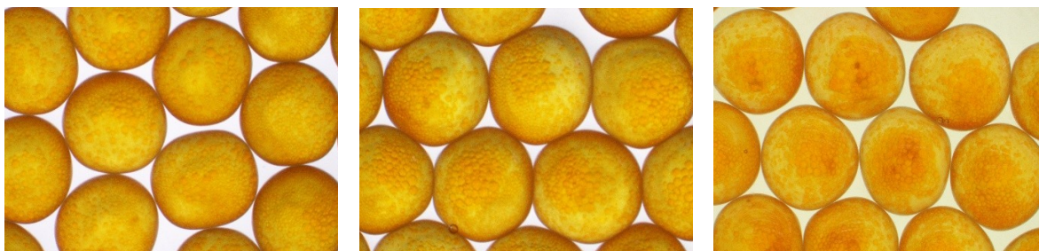
図2. 油球の分布による卵質の判定(左から○、△、×)