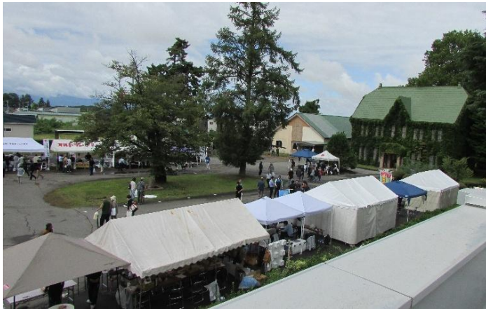
史料館前に並ぶ出店

特別ポスター展示では、栽培部は普通栽培における自然円錐形仕立てから開心形に至った樹形の変遷とわい化栽培の試験研究について、品種開発部は、明治時代の「国光」、「紅玉」など7大品種から現在の「ふじ」、「つがる」などへの変遷と品種開発について、病害虫管理部は、時代ごとの発生病害虫とそれらに対応した防除暦の変遷について展示しました。また、ほ場見学ツアーでは各ポイントでの研究員の説明に多くの人が聞き入っていました。