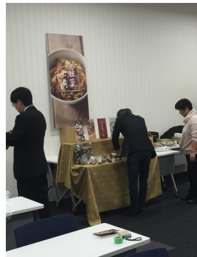
相談によって、デザイン、商標、展示指導へつながった事例