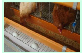
配合飼料に添加後、 採卵鶏へ給与