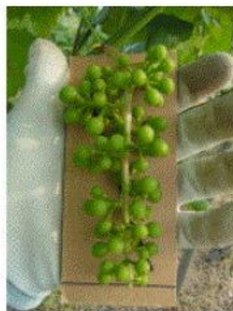
型紙とそれを利用して整形した後の果房