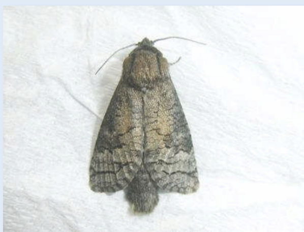
ヒメボクトウ成虫