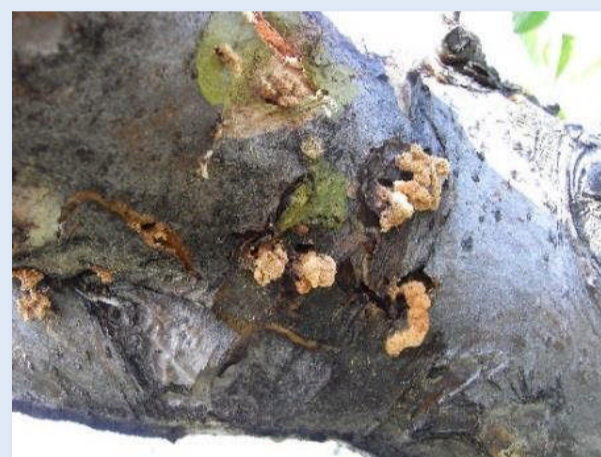
被害枝 (幼虫が枝幹へ食入)