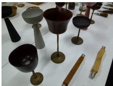
これまでの成果品や過去の試作品