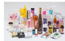
プロテオグリカン配合化粧品及び食品