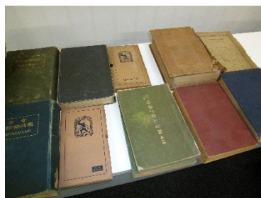
過去の書籍や実験ノート