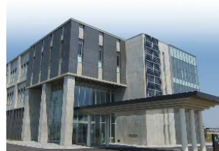
弘前工業研究所(令和4年現在)