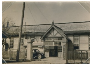
青森県工業試験場(昭和初期)