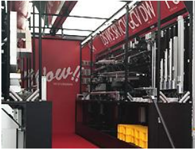
制御システム製品

機械ユニット製品・制御システム製品の2種類のキャラバンカーを展示し、自動化・省力化を実現する200以上のラインアップの紹介とコストを抑えて、製造現場の自動化を実現したい製造現場の具体的な改善事例を紹介します。