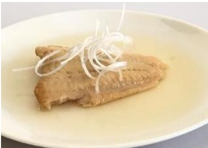
アイナメ焼き浸しレトルト