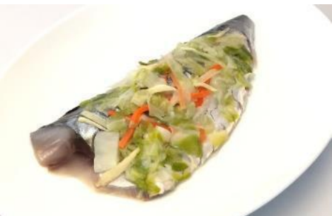
シメサバ浅漬あえ