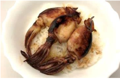
小イカ蒲焼井の素