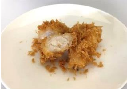
ブリ再成形フライ