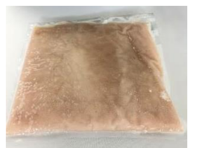
ホッケ冷凍すり身