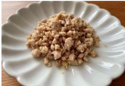
イナダ（ブリ未成魚）そぼろ