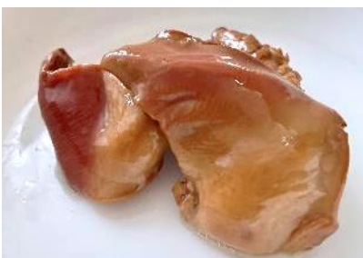
ホッキガイ燻製油漬レトルト