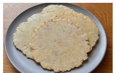
アミエビでん粉せんべい