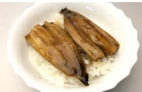
イワシ蒲焼井の素