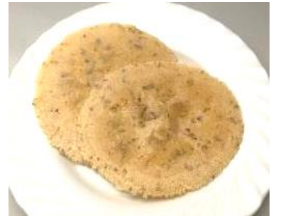
ホタテガイでん粉せんべい