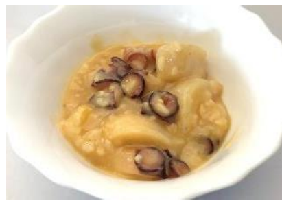
ミズダコ三升漬（酒粕味）