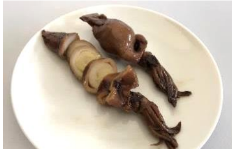
小イカ醤油煮 (うずら入)