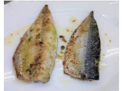
小サバネギ塩焼き