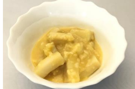
アカイカ三升漬 (西京味噌味)