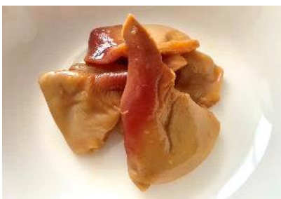
ホッキガイ甘酢漬