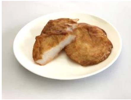
ホッケ揚げかまぼこ