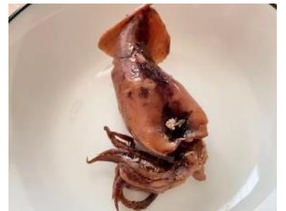
小イカ醤油煮 (真鱈子入)