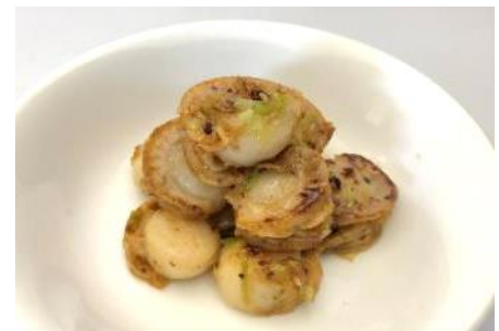
ホタテガイネギ塩焼き