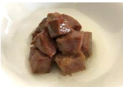
クジラ燻製油漬レトルト