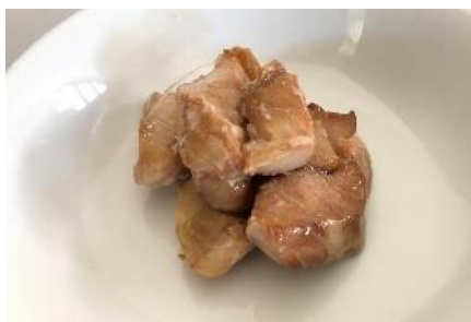
アイナメ燻製油漬レトルト