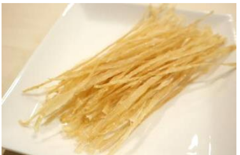
ホタテガイ外套膜調味干物 (洋風)