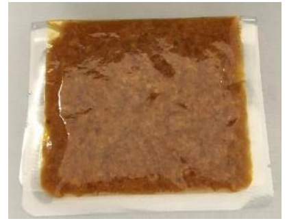
ブリマトソースレトルト