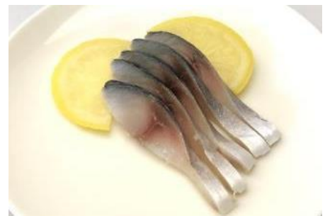
レモン風味シメサバ