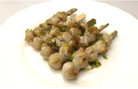
スルメイカトンビ串焼き (ネギ塩味)