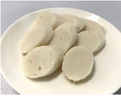
ホッケ蒸しかまぼこ