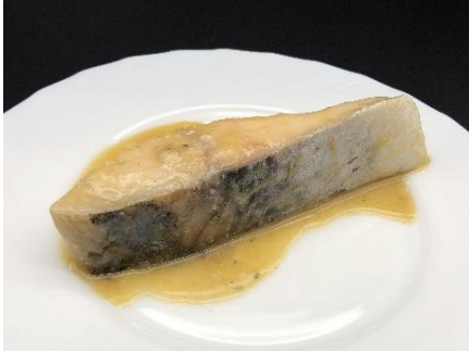
サワラ和風コンフィ