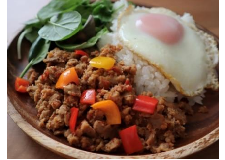
サバガパオライスの素