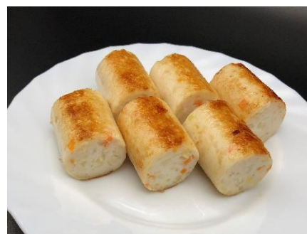
サメつくね軟骨入り