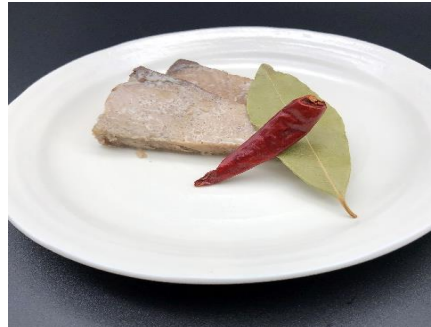
イナダ（ブリ未成魚）コンフィ