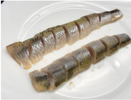
シメイワシキムチ風味