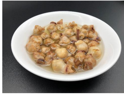
焼きトンビコンフィ