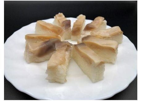
ホッキ冷凍押し寿司