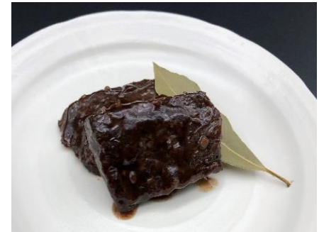
クジラ赤ワイン煮込み