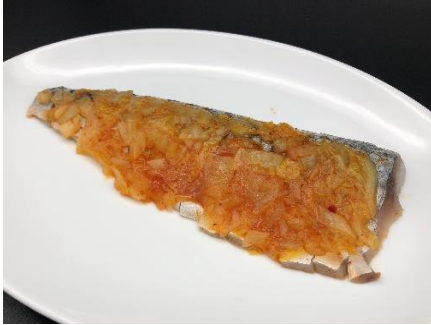
シメサバキムチ浅漬け和え