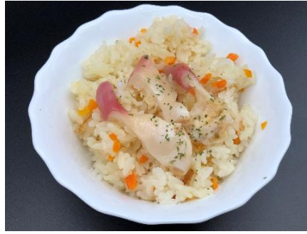
ホッキピラフの素