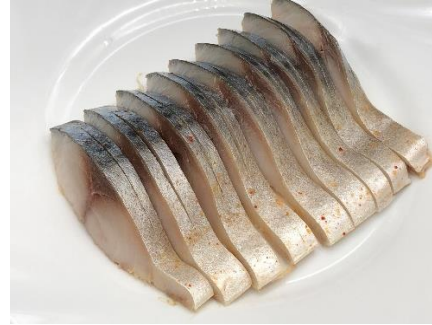
シメサバキムチ風味