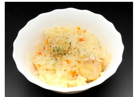
ホタテピラフの素