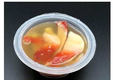
ホッキ液浸カップ (和風)