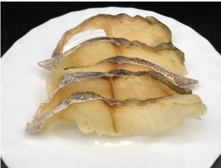
マダラ調味スライストバ