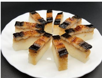
ウナギ蒲焼冷凍押し寿司