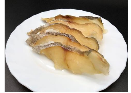
マダラスライストバ