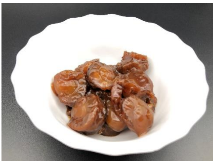
ホタテ佃煮 (バター醤油風味)