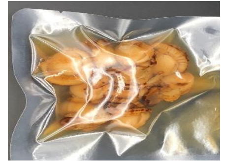
ホタテ焼き浸しレトルト