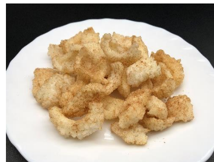
醤油おかき (ホタテ風味)