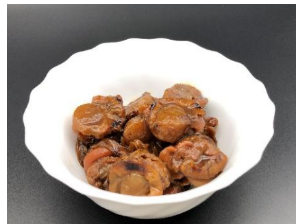
ホタテ甘露煮 (バター醤油風味)