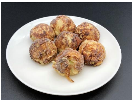
ホタテボール焼き (たこ焼き風)