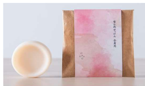
図2 商品化された「雪の泡せっけん全身用」