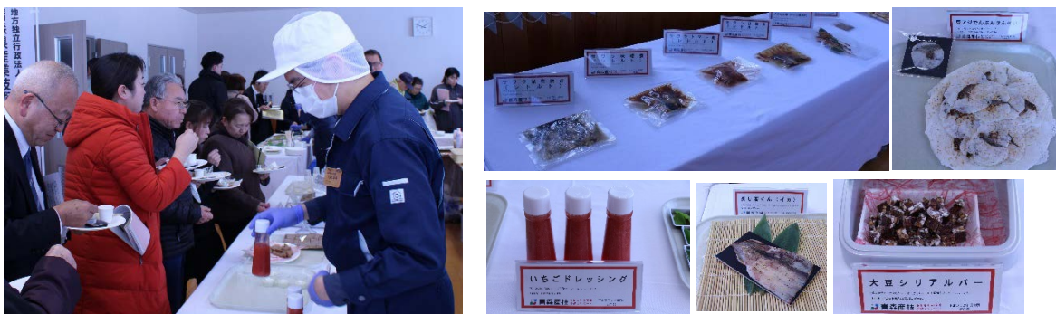
令和元年度展示試食会の様子